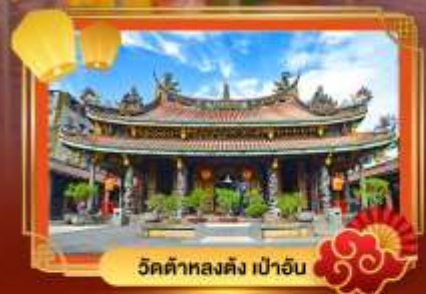
วัดต้าหลงตั้ง เป่าอัน