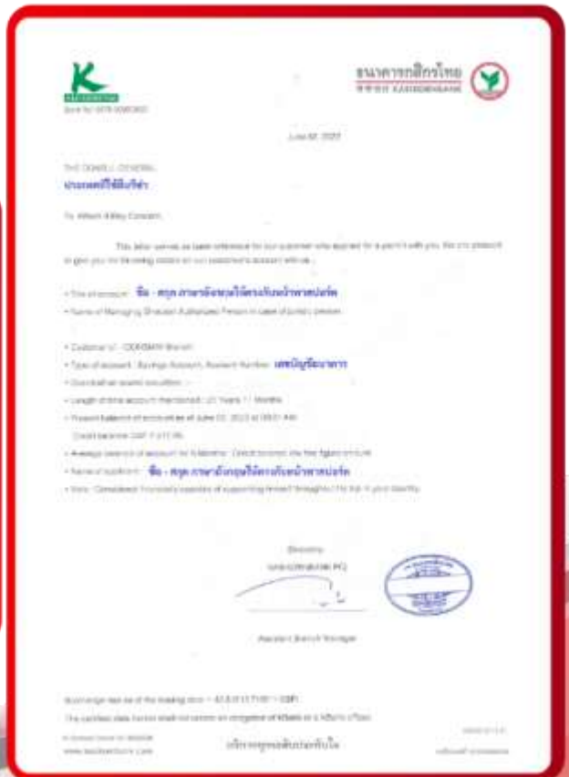
ตัวอย่าง Bank Guarantee ที่ผู้สมัครต้องยื่นธนาคาร