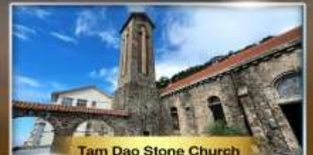
Tam Dao Stone Church