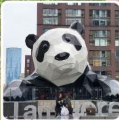
แพนด้าปิ่นตึก IFS