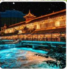
Blue Tears สะพานหนานเจียว