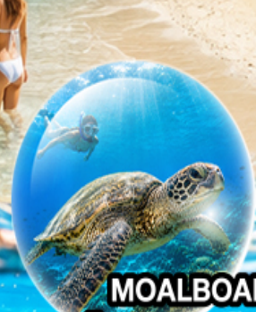
MOALBOAL ISLAND HOPPING (ดำน้ำดูปลา, เต่า, ว่ายน้ำกับปลาชาร์ตัน)