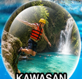
KAWASAN Canyoneering (Optional)