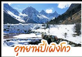
อุทยานปีศาจโกว

หมื่นพันด้านออนเซฟี่ • สะพานโบราณหนานเฉียว • ภูเขาหิมะวาวู เมืองโบราณกวนเซี่ย • อุทยานปีศาจโกว • อุทยานต้ากู่ปิงชวน ยอดเขาจ้อไบ๊ • วัดเป่ากั๋ว • ล่องเรือชมมรดกโลกหลวงพ่โตเล่อซาน วัดต้าฉือ • ถนนไท่กู่หลี่ • ถนนซุนซื่อ • ถนนโบราณชอยกว้างชอยแคบ