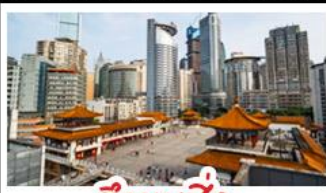
ตึกยูนชิ่ง

พระแกะสลักหินต้าจู้ - หลุมฟ้าสะพานสวรรค์ - เขานางฟ้า ตึกยูนชิ่ง - ตึกตะเกียบ หมู่บ้านโบราณฉือซีไห่