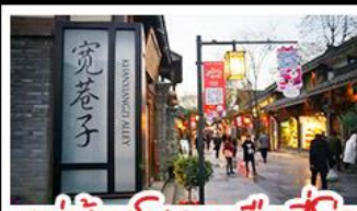
หมู่บ้านโบราณฉือซีไห่