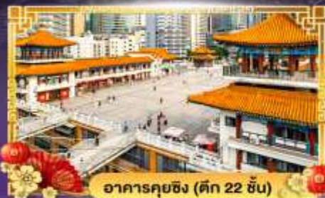
อาคารคุยฉิ่ง (ตึก 22 ชั้น)