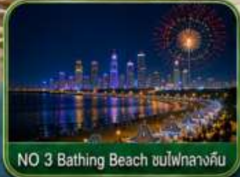
NO 3 Bathing Beach ชมไฟกลางคืน