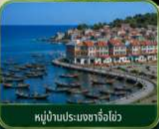
หมู่บ้านประมงซาจื่อไ่