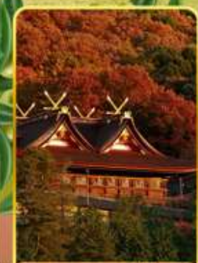
ศาลเจ้าคิมิฮิโตะ

ออนเซ็น 4 คั้น นน.กระเป๋า 23 กก.X2 8Days 5Night