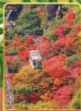
กระเช้าหุบเขาคังคาเคอิ