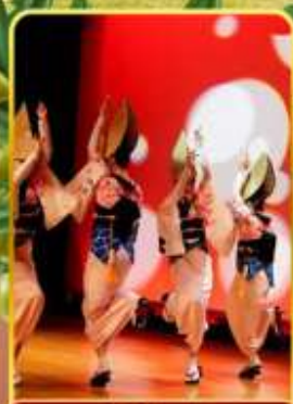
อะวะ โอะโตะริ โคคัง