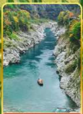
ส่องเรือช่องเขาโอบิเคะ