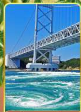
ช่องแคบนารุโตะ