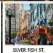
SILVER FISH ST.