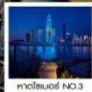
หาดโซเบอร์ NO.3

ของที่ระลึก สุดพิเศษ!! ขวดเบียร์สกรีนรูปของท่าน รัับฟรี!! ท่านละ 1 ขวด