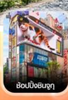
ซูปบึงชินจูกุ