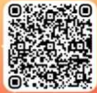
ไฮไลท์ทั้งหมด