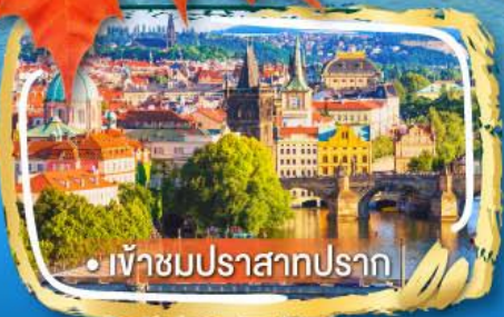
• เข้าชมปราสาทปราก