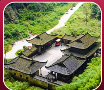
"อุทยานหลุมฟ้า"

T2G-CKG34(3U) The Best Chongqing...ฉงชิ่ง ต้าจู้ อุ่หลง เขานางฟ้า 5D 4N (3U)