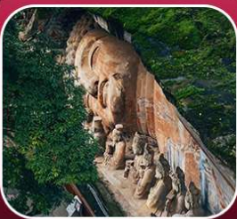
"ผาหินแกะสลักต้าจู้"