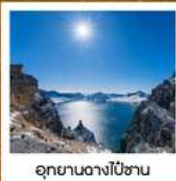
อุทยานดางโป่ซาน