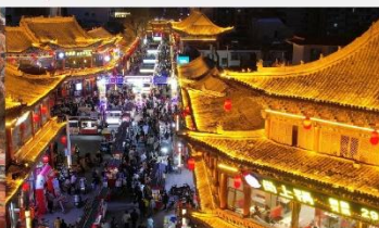
ตลาดกลางคืนจางเย่

*ทางบริษัทฯ ขอสงวนสิทธิ์ในการสลับโปรแกรมทัวร์ตามความเหมาะสมขึ้นอยู่กับสถานการณ์หน้างาน โดยคำนึงถึงผลประโยชน์ของลูกค้าเป็นสำคัญ