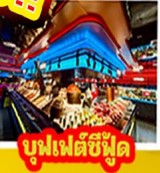
มูฟเฟลชีฟู๊ด