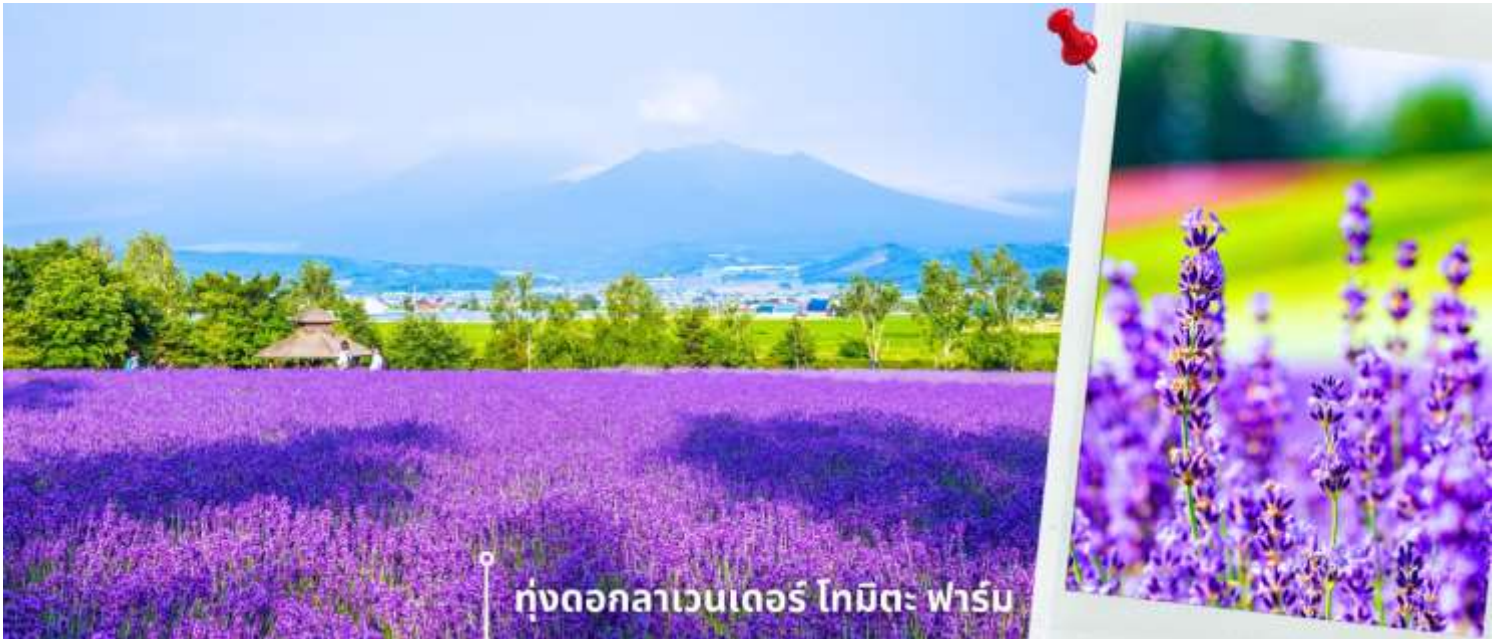
ทุ่งดอกลาเวนเดอร์ โกมิตะ ฟาร์ม

ภายในฟาร์มมีการจัดพื้นที่อย่างเป็นระเบียบ ให้ท่านสามารถเดินชมดอกไม้ ถ่ายภาพ และเพลิดเพลินกับบรรยากาศ นอกจากนี้ยังมีร้านจำหน่ายผลิตภัณฑ์จากลาเวนเดอร์ เช่น ของที่ระลึก ขนม เครื่องดื่ม ให้ท่านได้อิสระตามอัธยาศัย