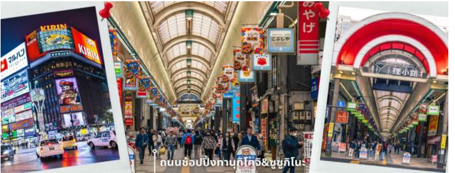
ถนนช้อปปิ้งทานุกิโคจิ&ชูชุกิโนะ

หลังรับประทานอาหารเที่ยง นำท่านเดินทางสู่ DUTY FREE ให้ท่านได้ช้อปปิ้งสินค้าปลอดภาษี เครื่องสำอาง ของใช้ ก่อนจะพาท่านเดินทาง ถนนช้อปปิ้งทานุกิโคจิ เป็นถนนช้อปปิ้งที่ตั้งอยู่แทบจะใจกลางเมือง Sapporo โดยมีร้านค้า ร้านอาหาร ห้างสรรพสินค้า ร้านเกม และโรงแรม รวมกันมากกว่า 200 เรียงรายยาวตั้งแต่ทิศตะวันตก ยันทิศตะวันออกยาวถึง 1 กิโลเมตร และยังมีบันไดเลื่อนลงไปทางเดินใต้ดินอีกด้วย ซึ่งทางเดินใต้ดินก็ยังมีร้านค้า ร้านอาหารอีกมากมายด้วยเช่นกัน ถนนช้อปปิ้งแห่งนี้เป็นที่ที่หลังจากแทบจะตลอดทาง ดังนั้นแล้วไม่ว่าจะฝนตก