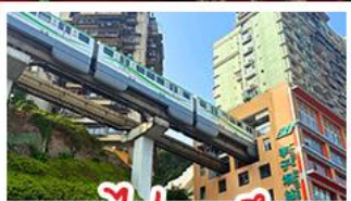
รถไฟทะลุคด