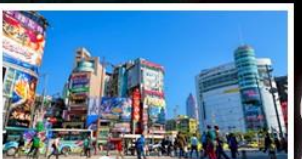
ซ้อป๋ิงซีเหมินตง