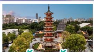
วัดเลงเซ้ง