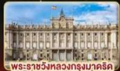
พระราชวังหลวงกรุงมาดริด