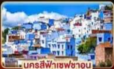
นครสีฟ้าเซฟซาอูน

📅 เดินทาง: 18-27 ต.ค. | 02-11 ธ.ค. 69 27 ธ.ค. 69 - 05 ม.ค. 70