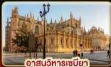
อาสนวิหารเซบิยา