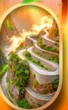
หุบเขาป้ายจ้าง