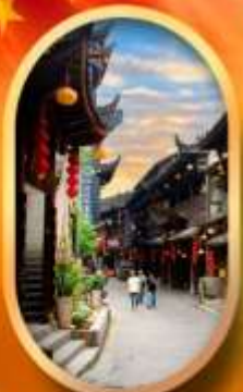
เมืองโบราณฟูหลงเจี้ยน