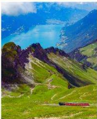
BRIENZER ROTHORN Sorenberg Schonenboden