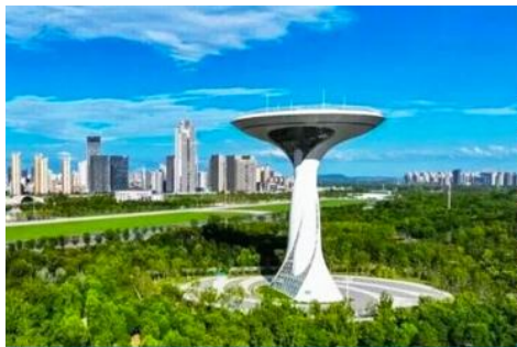
สวนสาธารณะลั่วกั๋ว

เช้า รับประทานอาหารเช้า ณ ห้องอาหารของโรงแรม (8)