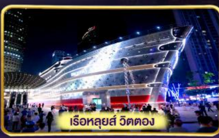
เรือหลุยส์ วัดตอง