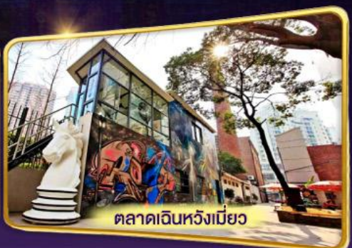
ตลาดเดินหวังเมียว