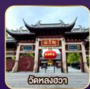
วัดหลงอา