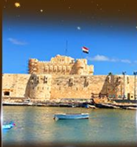
บึงนรากรม Quite Bay