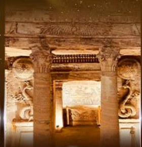
สุสานใต้ดินอเล็กซานเดรีย