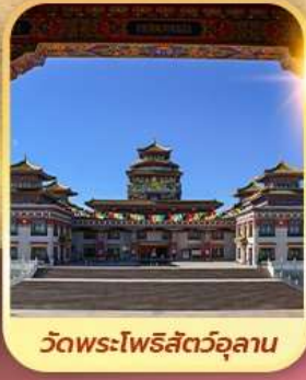
วัดพระโพธิสัตว์อูลาน