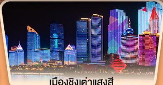
เมืองซิงต้าแสงสี