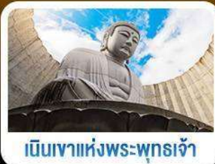
เนินเขาแห่งพระพุทธรเจ้า