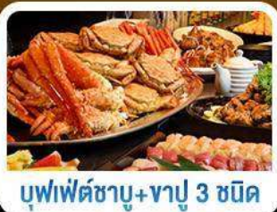
บุฟเฟ่ต์ซาบู+ซาบู 3 ชนิด