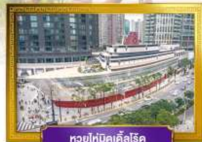
ทวยไห่บิคเคิลโรด