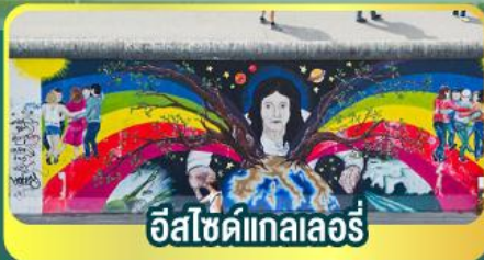
อีสไซด์แกลลอรี่