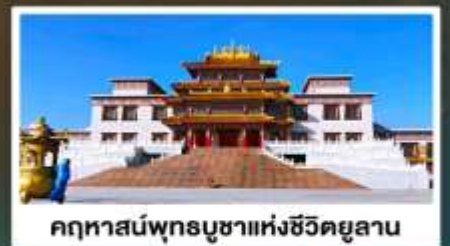
คฤหาสน์พุทธบูชาแห่งชีวีดยูลาน