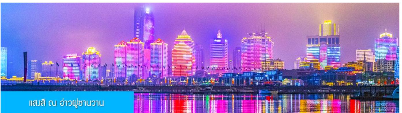
แสงสี ณ อ่าวภูเขาฉวน

ค่า รับประทานอาหารค่ำ ณ ภัตตาคาร *เมนูซีฟู้ด (3)