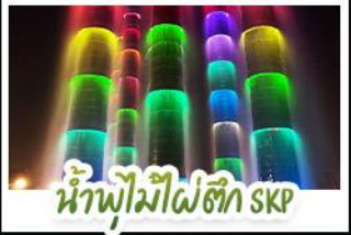
น้ำพุไม้ไผ่ตึก SKP

ภูเขาสี่ดรุณี • อุทยานหวงหลง • เมืองโบราณซงพาน • ทะเลสาบเต๋อซี อุทยานจิวจ้ายโกว • จัตุรัสหย่างเทียนหู่ • รูปปั้นหมีแพนด้าเซลฟี ถนนโบราณชอยกวางชอยแคบ • ถนนคนเดินไท่กู่หลี่ • ถนนคนเดินซุนซี แพนด้ายักษ์ปิ่นตึก ณ ตึก IFS • วัดต้าฉีฉี • น้ำพุไม้ไผ่ตึก SKP