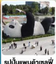
รูปปั้นแพนด้าเซลฟี่