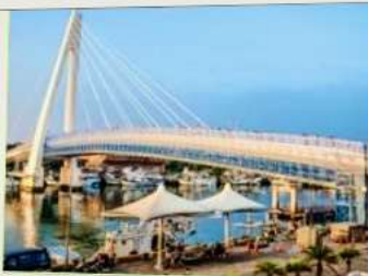
สะพานคู่รักตั้นส่วย