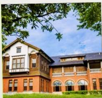
พิพิธภัณฑน์น้ำพุร้อนเป่ย์โถว