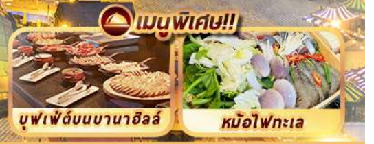
บุฟเฟ่ต์บนบานาฮิลล์