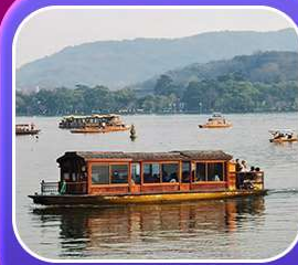
“ล่องเรือทะเลสาบซีหู”