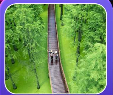
“ป่าสนชิงซาน”

T2G-HGH01GJ Welcome Hangzhou...หังโจว ฉู่โจว ฉู่หยวน ช่างเหรา หุบเขาเทวดา 5D 4N (GJ)