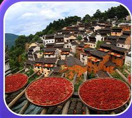
“หมู่บ้านหวงหลิง”

หุบเขาเทวดาวังเซียนกู่ หมู่บ้านที่ตั้งอยู่ริมหน้าผา • หมู่บ้านโบราณหวงหลิง ป่าสนน้ำชิงซาน • ล่องเรือทะเลสาบซีหู • ถนนโบราณตุ๋นโจว • ชมแสงสีที่ ฉู่หนีโจว