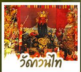
ว้ดกวนน้ท