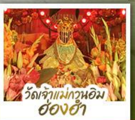
ว้ดเจ้าแม่กวนอิมอ่อ้งฮ้่า