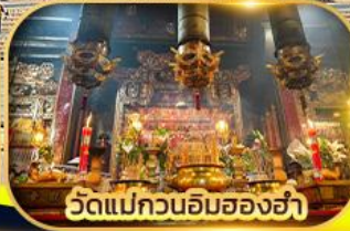
วัดแม่กวนอิมฮ่องฮ่า