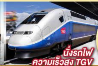
นั่งรถไฟความเร็วสูง TGV