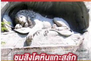
ชมสิงโตหินแกะสลัก