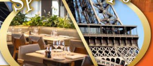
รับประทานอาหารกลางวันบนหอไอเฟล

ไฮไลท์ในโปรแกรม • สะพานไม้ชาเปล ลูเซิร์น