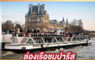
ล่องเรือชมปารีส