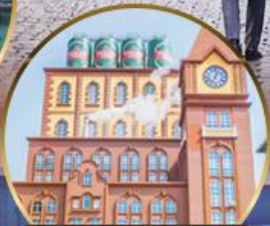
โรงงานเบียร์ชิงเต่า