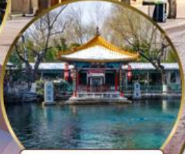
น้ำพุเปาหู