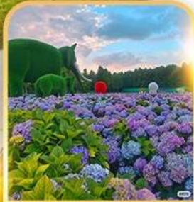
ดอกไม้ตามฤดูกาล