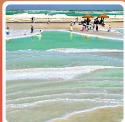
ทะเลสาบเกลือจาเอ้อหาน

ไฮไลท์! กำมั่วเกาตุ กำพุทศศิลปะโบราณ มรดกโลก UNESCO ภูเขาสายรุ้งจางเย่ ภูเขาหินสีสั่นแปลกตา หนึ่งในภูมิประเทศที่แปลกที่สุดในโลก