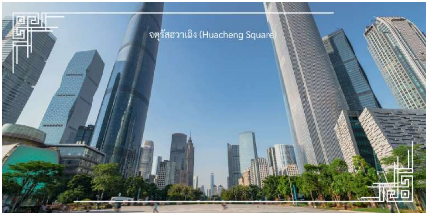
จตุรัสฮวาเฉิง (Huacheng Square)

ท่านชม จตุรัสฮวาเฉิง (Huacheng Square) หรือที่มีความหมายว่า “จัตุรัสดอกไม้” แลนด์มาร์กสำคัญใจกลางเมือง กวางโจว ที่ผสมผสานความรื่นรมย์ของธรรมชาติเข้ากับความทันสมัยของเมืองได้อย่างลงตัว บรรยากาศโดยรอบมีความร่ม