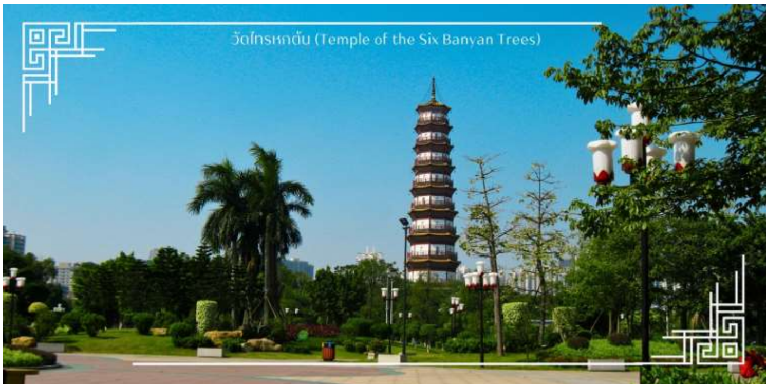
วัดอินทรทนต์ (Temple of the Six Banyan Trees)

นำท่านถ่ายรูปเช็คอินสวนสาธารณะเยอเซี่ยวซึ่งเป็นสวนสาธารณะขนาดใหญ่ที่สุดในเมืองกวางโจว และนำท่านชมอนุสาวรีย์แพะห้าตัว นับว่าเป็นอีกแลนด์มาร์กกวางโจว สัญลักษณ์ของแพะห้าตัวคาบรวงข้าว 6 รวง เป็นสัญลักษณ์ประจำเมืองกวางโจวมีการแกะสลักด้วยหินแกรนิตอย่างสวยงาม และบริเวณโดยรอบยังมีกิจกรรมการรำไทเก๊กของผู้สูงอายุและคนในชุมชนกวางเจาภายใต้บรรยากาศของสวนสาธารณะที่ร่มรื่น จึงเป็นที่พักผ่อนหย่อนใจได้ทั้งนักท่องเที่ยวและผู้คนในกวางโจวได้ดีเลยทีเดียว