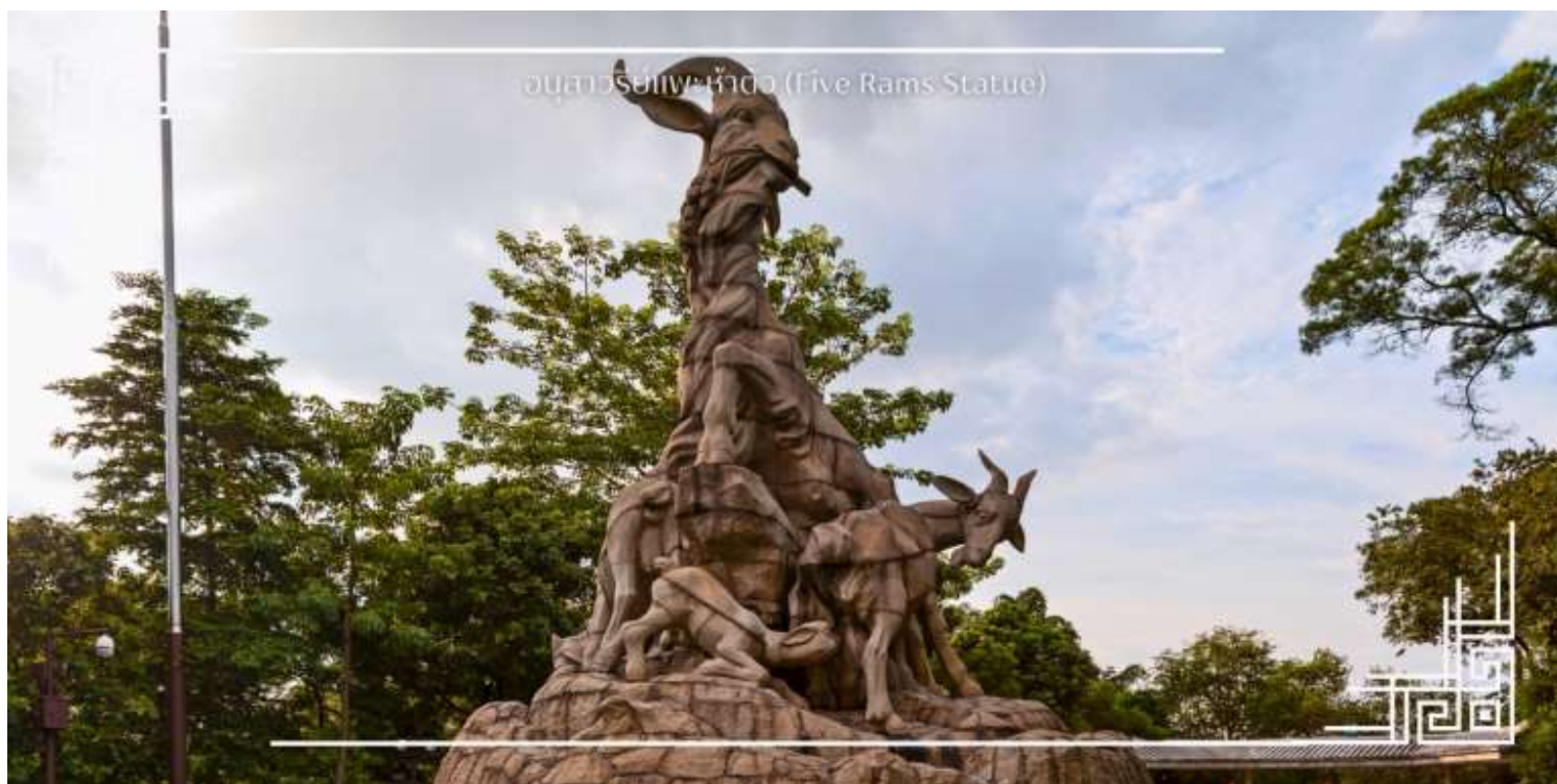
อนุสาวรีย์แพะห้าตัว (Five Rams Statue)

นำท่านถ่ายรูปเช็คอินสวนสาธารณะเยอเซี่ยวซึ่งเป็นสวนสาธารณะขนาดใหญ่ที่สุดในเมืองกวางโจว และนำท่านชมอนุสาวรีย์แพะห้าตัว นับว่าเป็นอีกแลนด์มาร์กกวางโจว สัญลักษณ์ของแพะห้าตัวคาบรวงข้าว 6 รวง เป็นสัญลักษณ์ประจำเมืองกวางโจวมีการแกะสลักด้วยหินแกรนิตอย่างสวยงาม และบริเวณโดยรอบยังมีกิจกรรมการรำไทเก๊กของผู้สูงอายุและคนในชุมชนกวางเจาภายใต้บรรยากาศของสวนสาธารณะที่ร่มรื่น จึงเป็นที่พักผ่อนหย่อนใจได้ทั้งนักท่องเที่ยวและผู้คนในกวางโจวได้ดีเลยทีเดียว