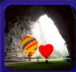
“ ถ้าถึงหลง ”