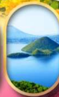
วิวทะเลสาบโทยะ