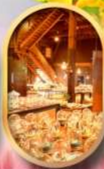
พรมกันที่กลองดนตรี