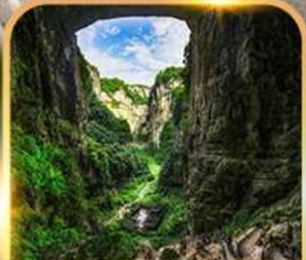
อุทยานหลุมฟ้า 3 สะพานสวรรค์