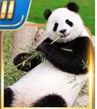
สวนสัตว์จงชิ่ง