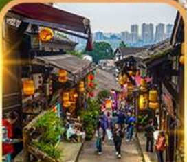
หมู่บ้านโบราณฉือชี่โจว