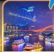
ส่องเรือแม่น้ำแยงซีเกียง