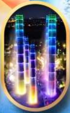
SKP Global Center