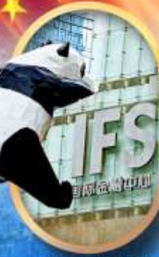
IFS หมีแพนด้าป็นตึก