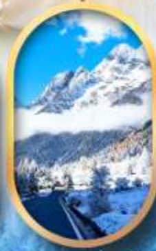
อุทยานสี่ครุณี