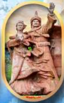
เมืองโบราณซงฟา