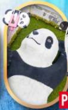
แพนด้าเซลฟี